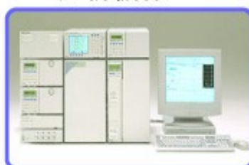
高速液体クロマトグラフ分析計