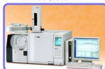
ガスクロマトグラフ質量分析計